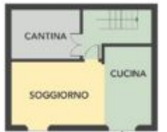
PIANO SEMINTERRATO 2