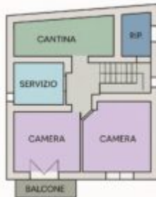
PIANO TERRA RIALZATO